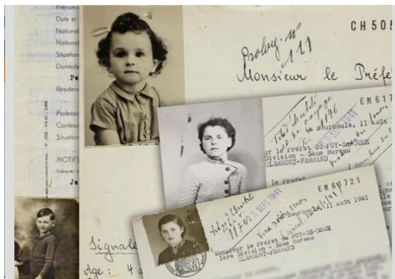
Photos et montage initial de l'image principale : G. Da Costa/Archives départementales du Puy-de-Dôme ; conception finale : Ph. Bourdin.